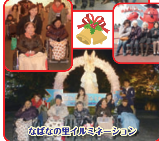
なばなの里イルミネーション

★いちご狩りやなばなの里イルミネーション等の外出に加え、新企画の御朱印巡りもスタートしました。利用者様の皆さんとても楽しまれ喜んでみえました。