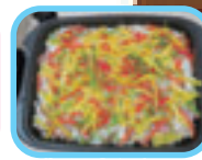
手作り昼食★バエリア