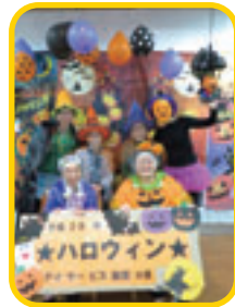
ハロウィンお菓子バイキング★