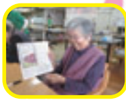
百人一首インテリア★