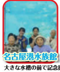
名古屋港水族館 大きな水槽の前で記念撮影パチリ！