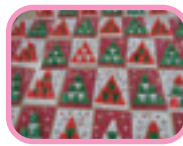
クリスマスツリー飾り