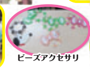
ビーズアクセサリー