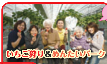
いちご狩り&めんたいパーク