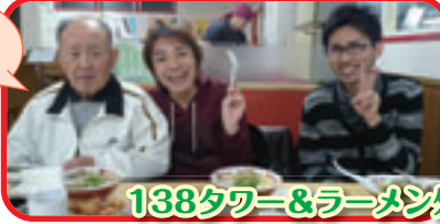
138タワー&ラーメン外出